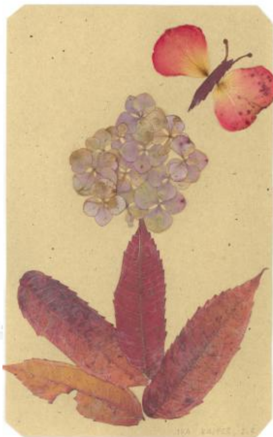
IVA KAJFEŠ 2.r.