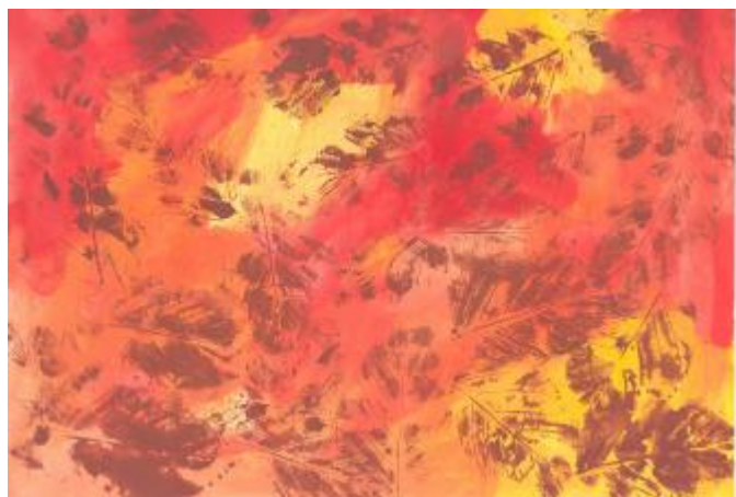
LOVRO ČENGIĆ 1.r.