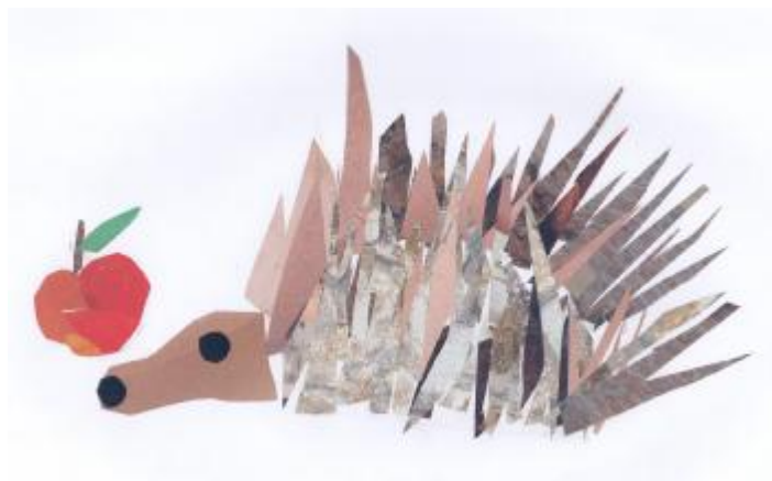
TEODORA KRALJ 1.r.