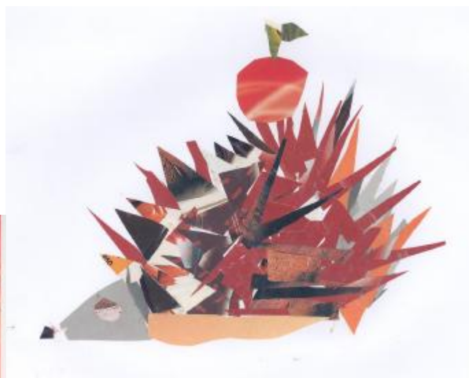
NATAŠA VUK 1.r.