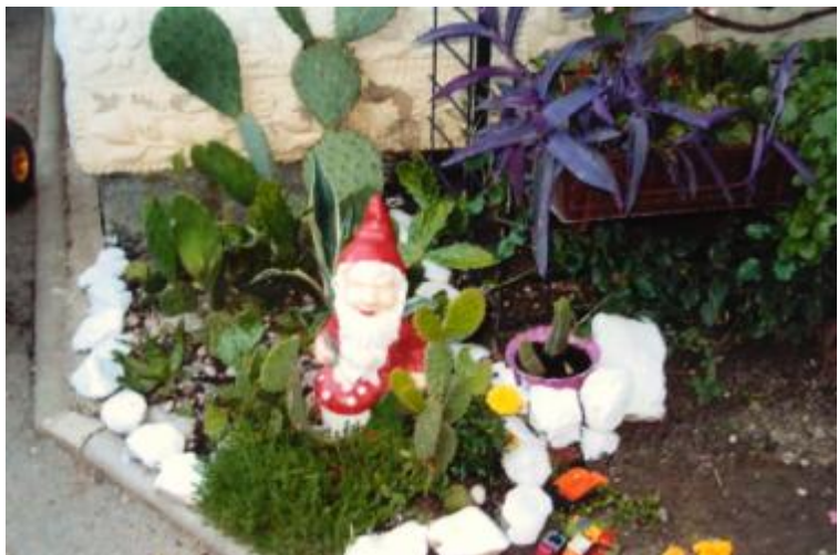
«Mini botanički vrt» Dragice i Dražena Coha, Luka, Lučka c.6.

Prvo i drugonagrađeni dobili su prigodne diplome te nagrade, a mi im zahvaljujemo na uljepšavanju naših naselja. Nadamo se da će se i slijedeće godine nastaviti trend uljepšavanja okućnica i balkona i posvećivanje pozornosti detaljima u našim dvorištima i vrtovima.